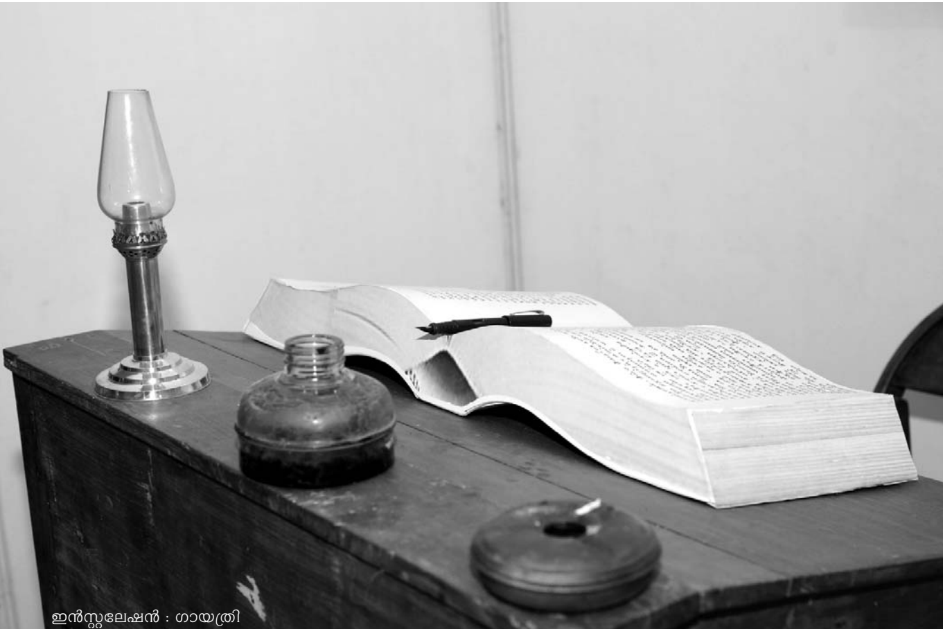
ഇൻസുലേഷൻ : തായത്രി