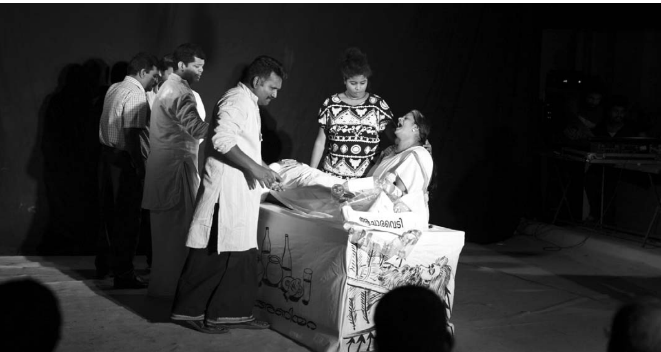
എൻ.എൻ.പിള്ള എഴുതി സി.എസ്.പ്രേംകുമാർ സംവിധാനം ചെയ്ത് രംഗചേതന തൃശൂർ അവതരിപ്പിച്ച ഞാൻ സ്വർഗത്തിൽ അഥവാ ഒരു ഭയങ്കരനാടകം എന്ന നാടകം.