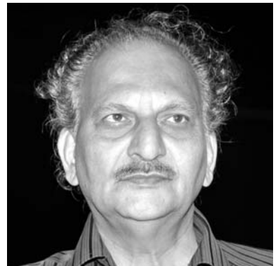
ഏഴാച്ചേരി രാമചന്ദ്രൻ ഏപ്രിൽ 9 ഞായർ 04:30