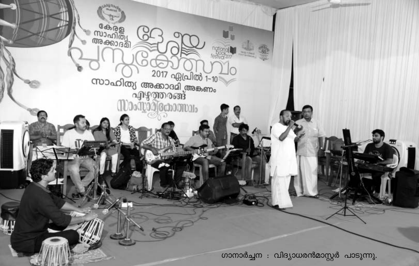
ഗാനാർച്ചന : വിദ്യാധരൻമാസ്റ്റർ പാടുന്നു.