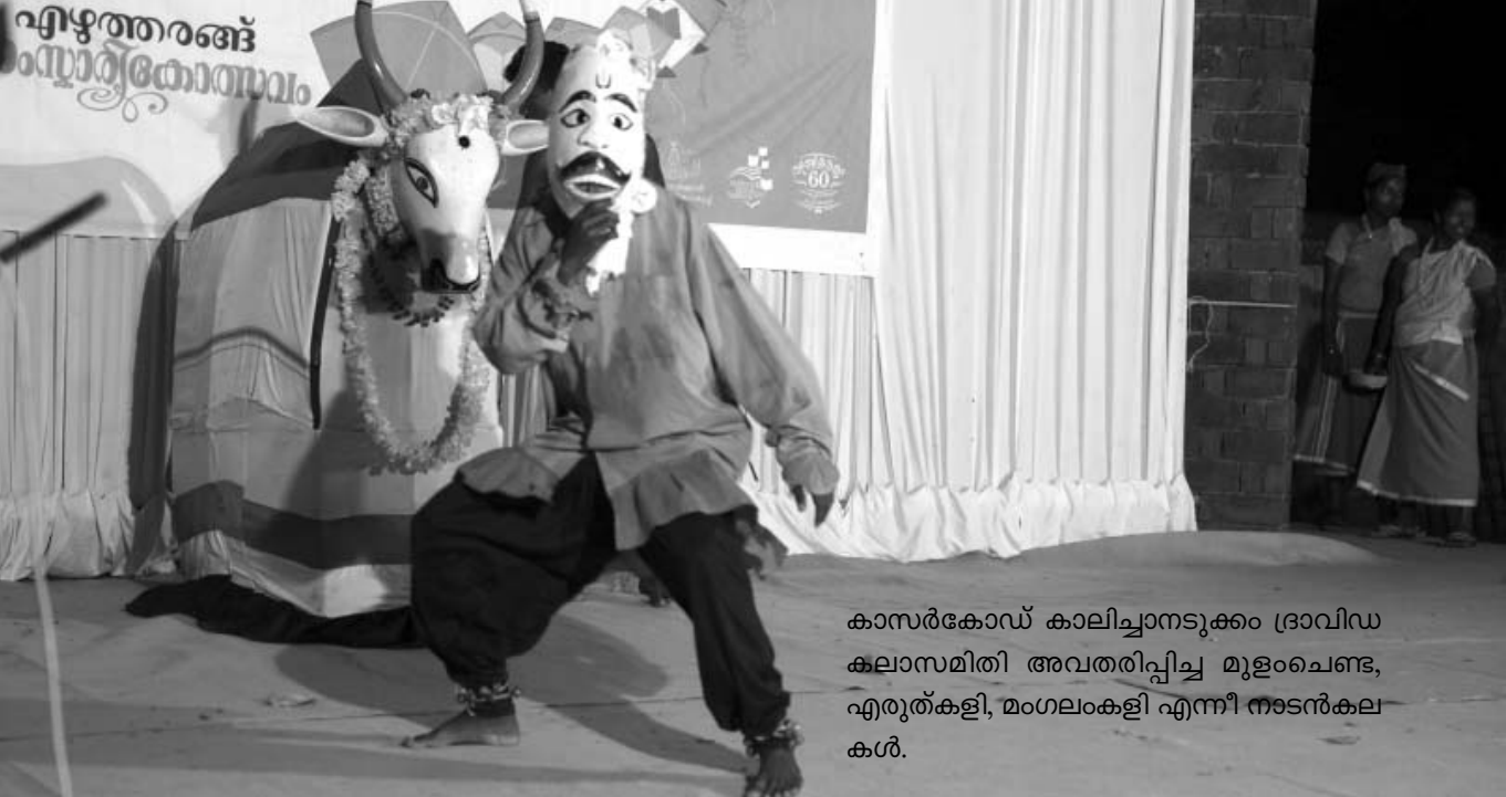
കാസർകോഡ് കാലിച്ചാനടുക്കം ദ്രാവിഡ കലാസമിതി അവതരിപ്പിച്ച മുളംചെണ്ട, എരുത്കളി, മംഗലംകളി എന്നീ നാടൻകലകൾ.