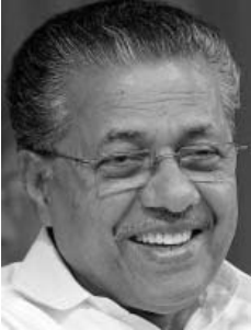
പിണറായി വിജയൻ കേരള മുഖ്യമന്ത്രി

കേരള ജനതയ്ക്ക് മഹാസ്വപ്നങ്ങൾ കാണാൻ കഴിവും കരുത്തും നൽകിയ ഇന്നലെകളുടെ ചരിത്രത്തിൽ, പുസ്തകങ്ങളും വായനയും ഗ്രന്ഥശാലാപ്രസ്ഥാനവും അതിമഹത്തായ പങ്കുവഹിച്ചിട്ടുണ്ട്. നവോത്ഥാനകേരളം ആധുനികതയിലേക്ക് കുതിക്കുമ്പോൾ, മാറ്റത്തിന്റെ മുൻനിരയിൽനിന്ന മഹാഗ്രന്ഥങ്ങൾ പരിവർത്തനത്തിനായുള്ള ഒരു പടയോട്ടംതന്നെ സാധ്യമാക്കി. കേരളസമൂഹം പുരോഗമനകാലത്തിന്റെ നിർഭയമായ സ്വാതന്ത്ര്യത്തിലേക്ക് ഉയർന്നത്, വായനയിലൂടെയും അതിലൂടെ അടിത്തട്ടോളം വ്യാപിച്ച ജനാധിപത്യപരമായ ആശയസംവാദങ്ങളിലൂടെയുമാണ്.