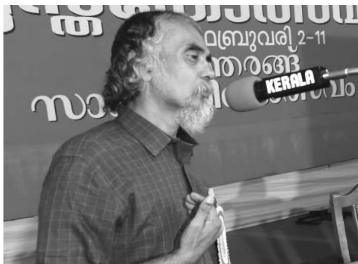
വായനയുടെ ജനാധിപത്യം കെ.ഇ.എൻ. സംസാരിക്കുന്നു.