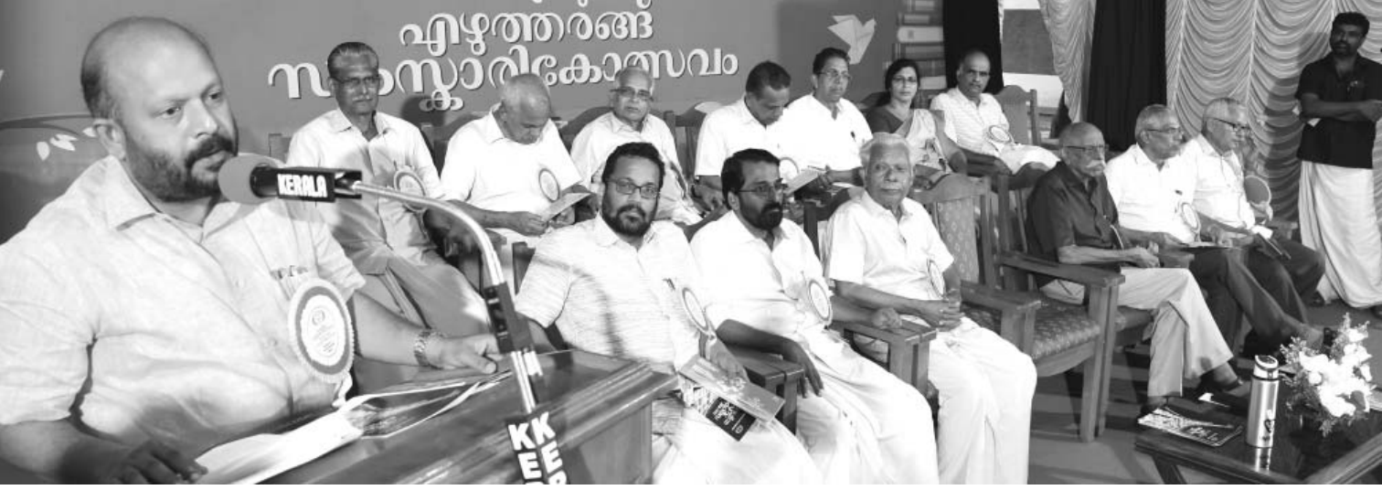
സമൂഹനതരായ ഗ്രന്ഥശാലാപ്രവർത്തകർക്ക് ആദരം. കൃഷിവകുപ്പുമന്ത്രി വി.എസ്.സുനിൽകുമാർ ഉദ്ഘാടനം ചെയ്യുന്നു.